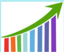
График перехода на новые ФГОС начального общего и основного общего образования